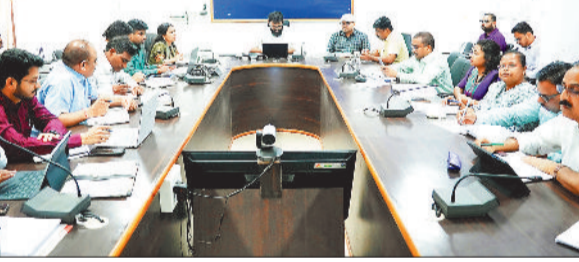
एलपीजी टंकी के अवैध भंडारण और कालाबाजारी पर हो सख्त कार्रवाई