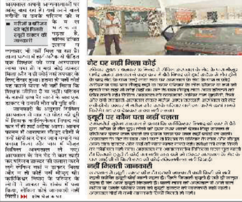
ज्वाइंट डायरेक्टर ने शिक्षक की मौत के बाद सिविल अस्पताल में मतकते रहे परिजन